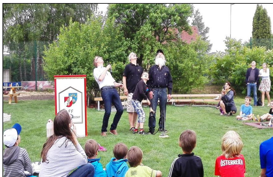
Raketenstart bei der Eröffnung des Abenteuerspielplatzes am Samstag, den 11. Juni 2016