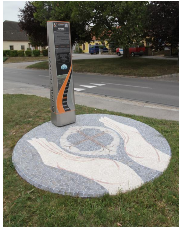
Planetenweg: „Die Erde“