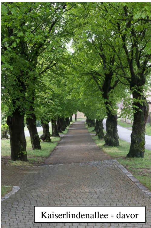
Kaiserlindenallee - davor

Im Sommer dieses Jahres mussten die kranken Bäume auf dem Weg zur Kirche in Kleinwilfersdorf aus Sicherheitsgründen entfernt werden.